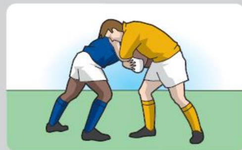
Maul no formado